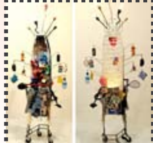
Karol Bergeret SuperWomanShiva 2010