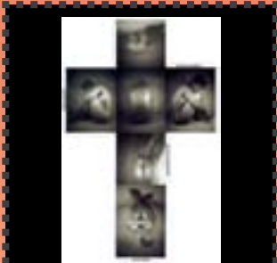
Marta Darder pixa't al llit 2002