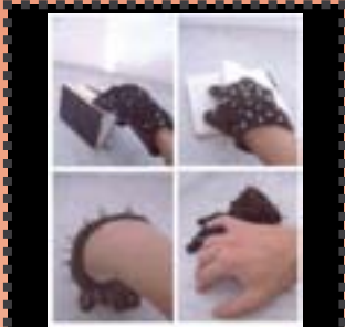
Carme Ayzza Buitó Protecció 2005