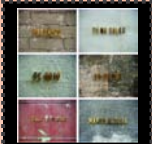
Irene Salas Sin título-serie sobre el maltrato psicológico. 2008