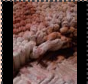
Caco Empowerment Perquè em surt del cony 2009