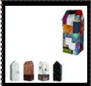
Mais Ales Ales 2006