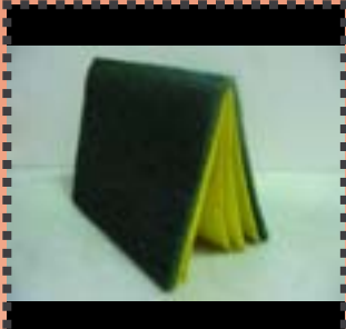
Guida Ribé Rovira El meu lloc en el món 2006