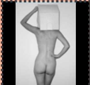
Mònica Porta Casa llista para llevar 2006