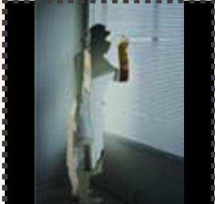
Eiko Sugi Sin título 2007